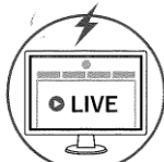
インターネットでの配信