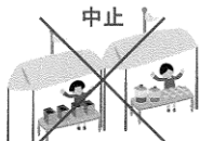
通常の運動公園での開催