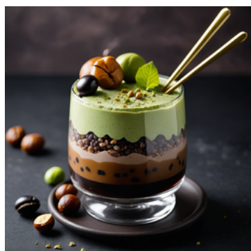
例① 黒豆とナッツの 抹茶ミニパフェ

例①と例②の商品名、ポイントとなる文章を Canvaに入力し、イメージ写真を作成する。