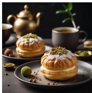
例② ほうじ茶クリームと 甘納豆シュークリーム